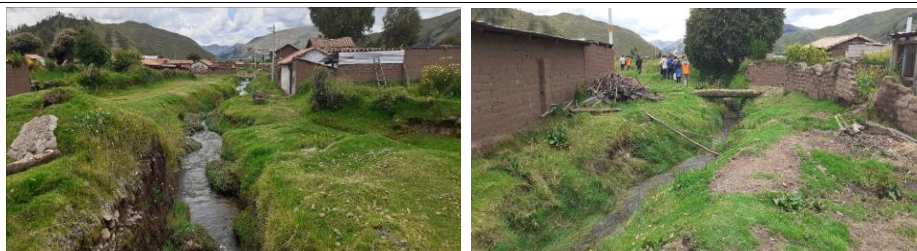
FOTO 01: Inicio de identificación de punto crítico del río TUCURAMAYU, se aprecia viviendas familiares asentadas paralelo al cauce del río.