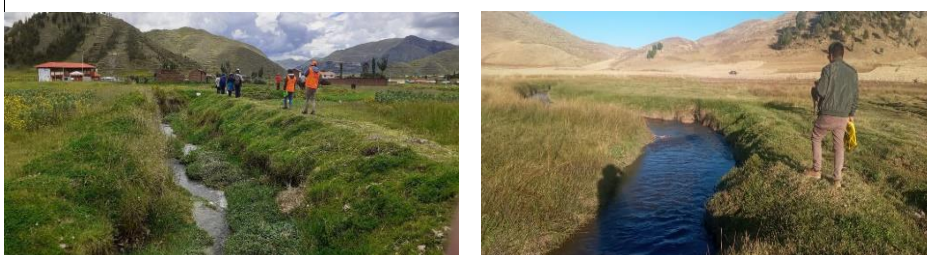
FOTO 03: Cauce colmatado y estrangulada, el cual interrumpe el normal flujo del agua, requiriendo la limpieza y descolmatación del cauce.