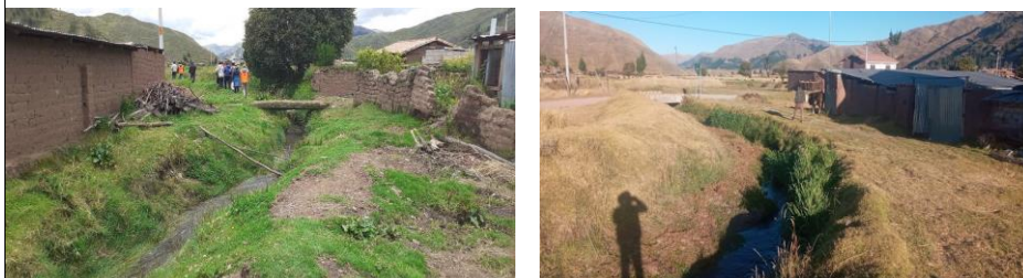
FOTO 02: Cauce estrangulada y colmatada se precia taludes naturales en ambas márgenes del río Tucuramayu - comunidad Chosecani